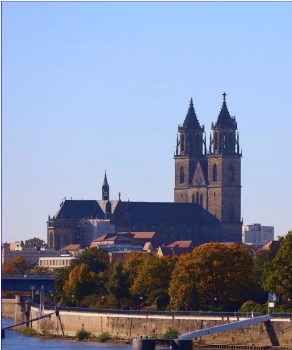
Cathédrale De Magdebourg

Hébergement : Nuit en hôtel à Magdebourg