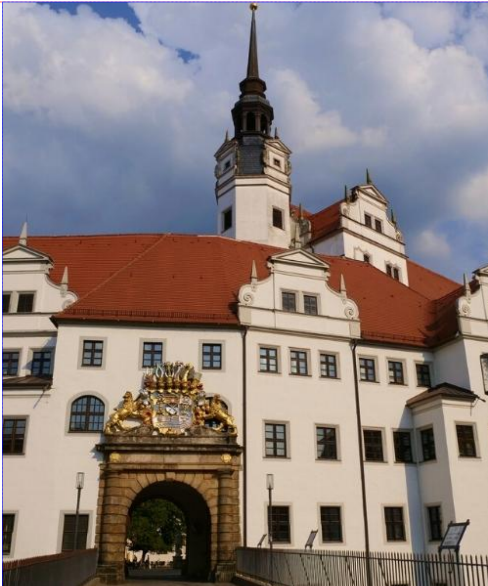
Le château Hartenfels à Torgau