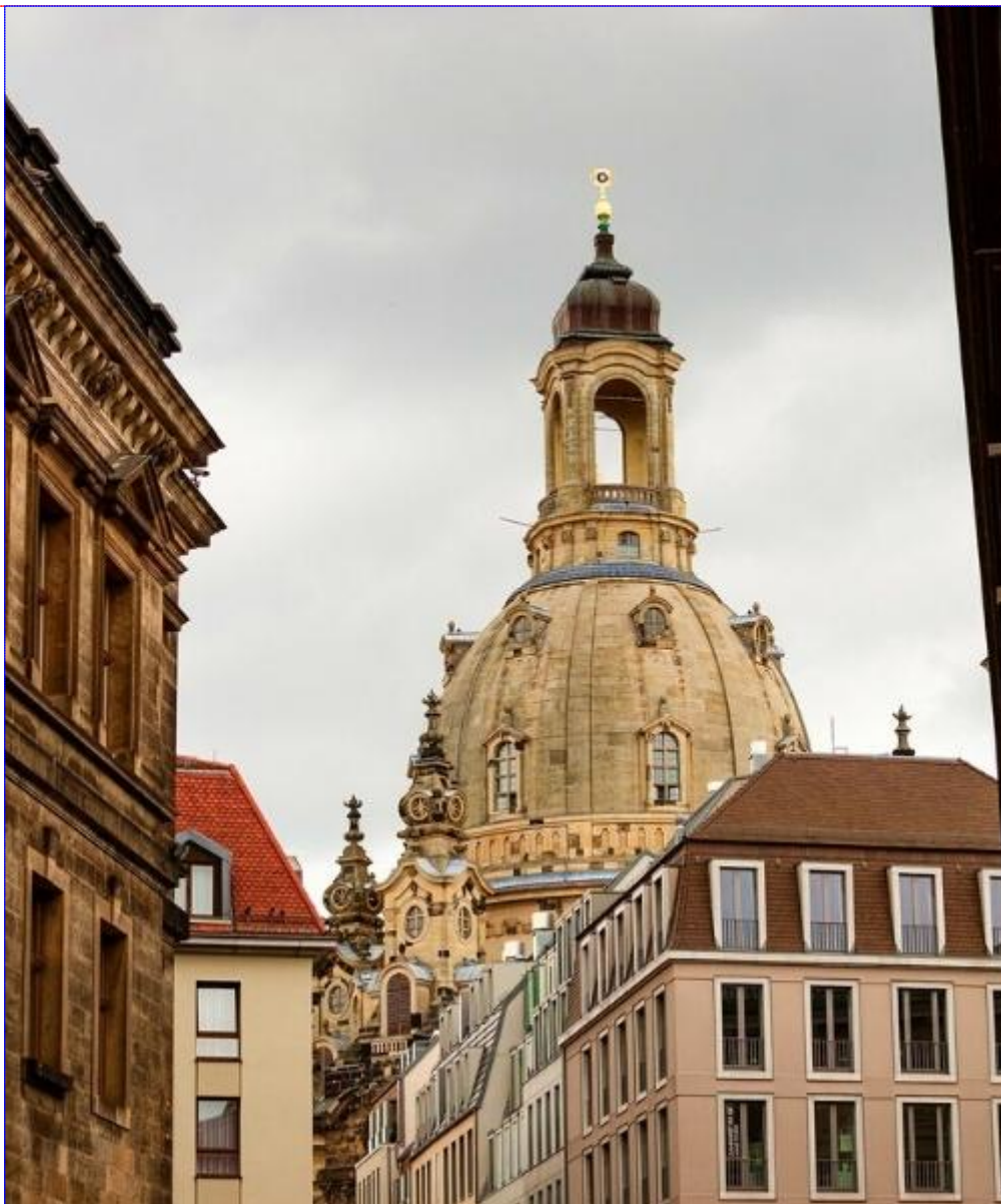
L'église Frauenkirche de Dresde