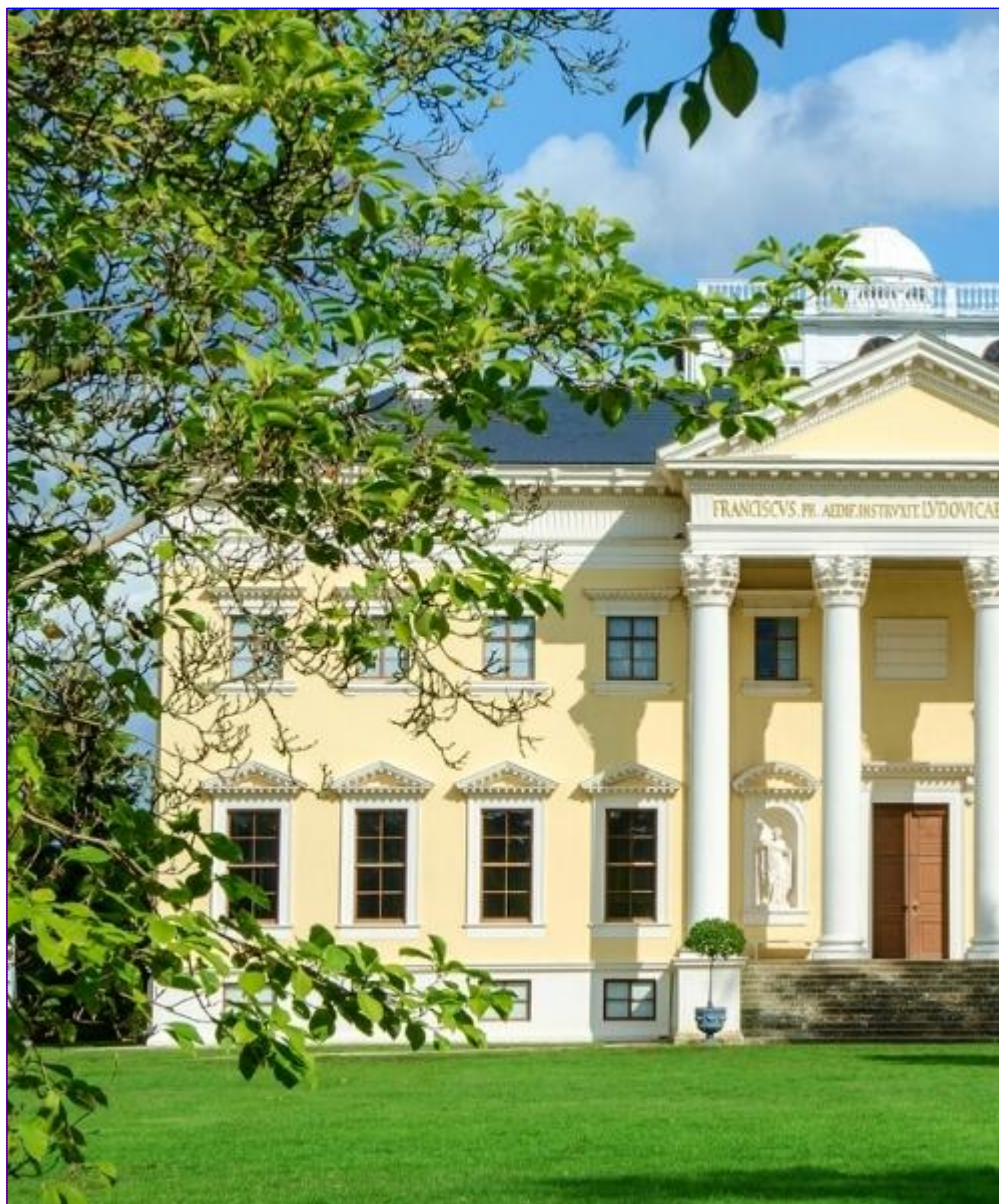
Les jardins de Würzburg