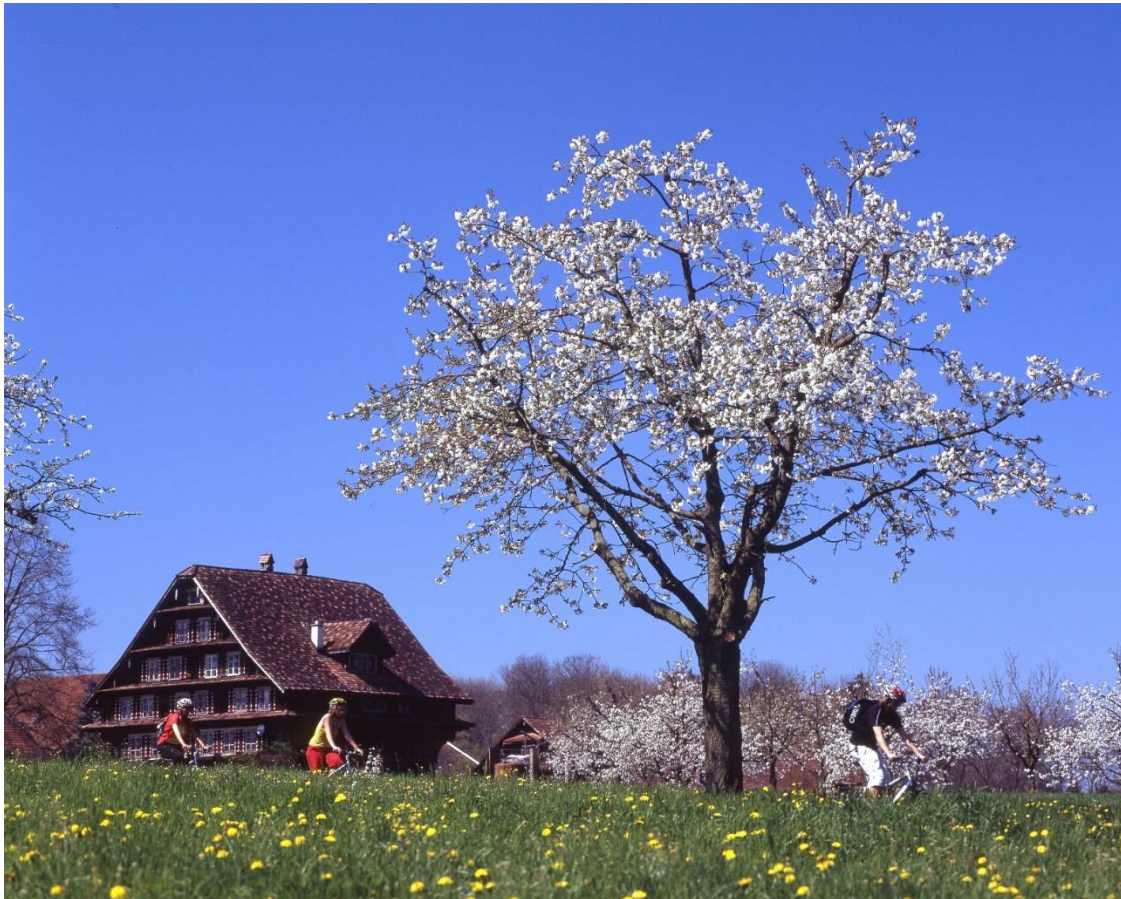
Cyclistes sur la Route des lacs

7 jours • 6 nuits • Rien à porter • Niveau : 4/5