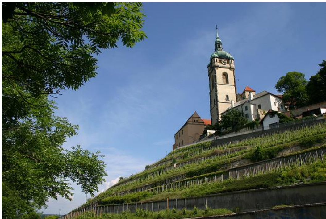
Château de Mělník