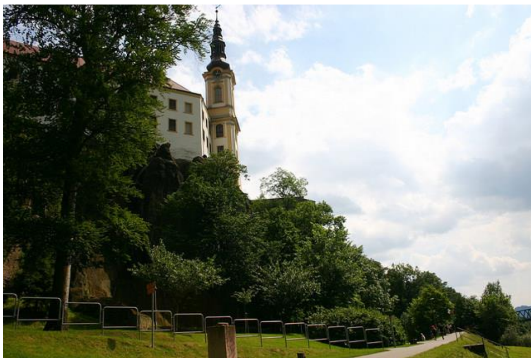
La piste cyclable de l'Elbe à Decin