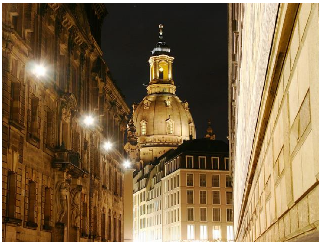
Eglise Notre-Dame de Dresde

Retour individuel. Vous pouvez réserver avec nous le retour en minibus tous les vendredis à 14h de Dresde à Prague. Nous pouvons organiser un transfert privé sur demande les autres jours.