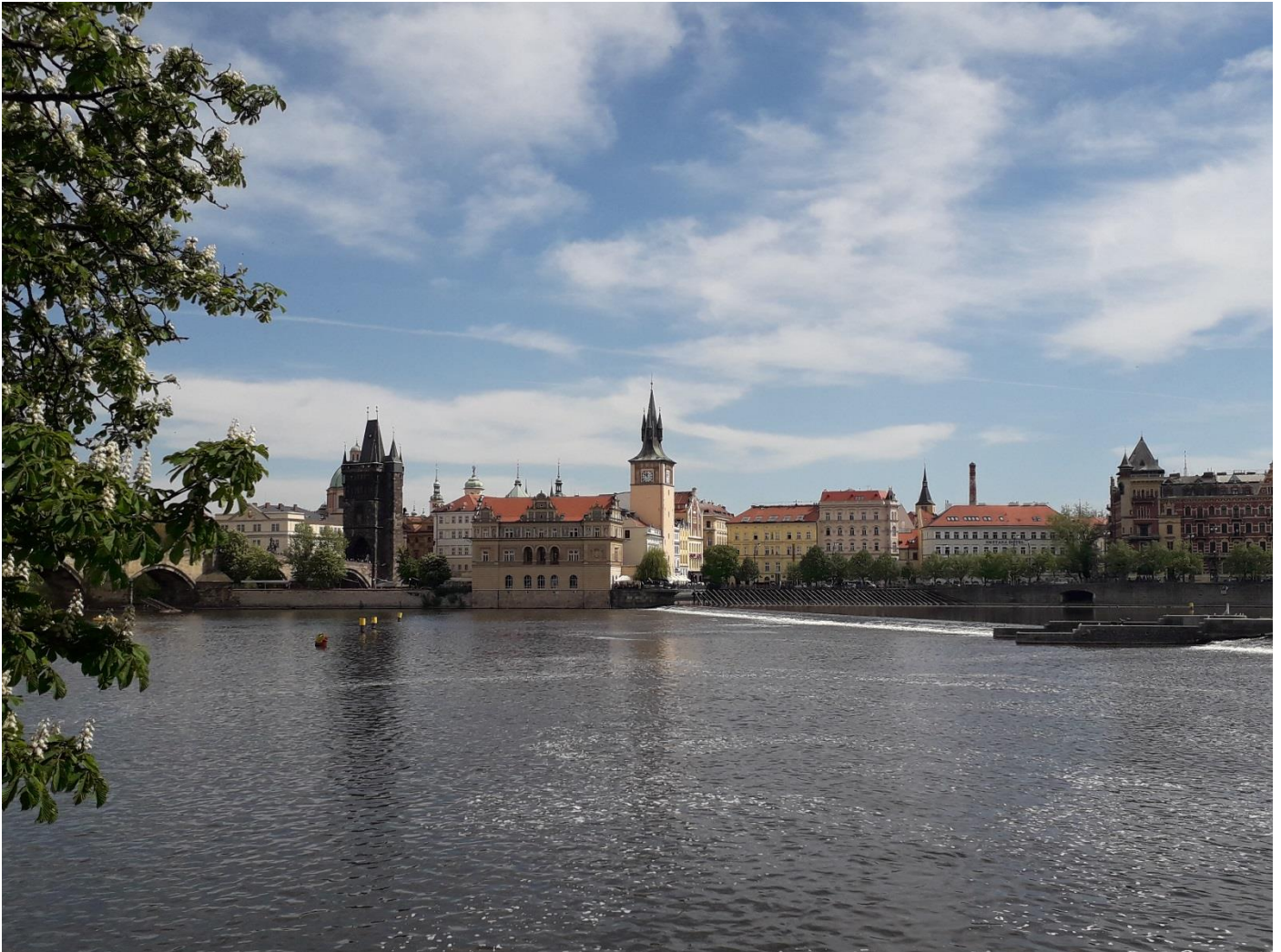
Prague et la Moldau

8 jours / 7 nuits • Rien à porter • Niveau : 2/5