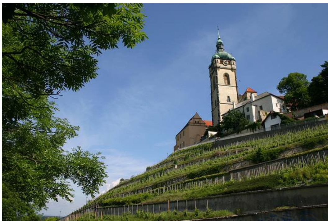
Château de Mělník