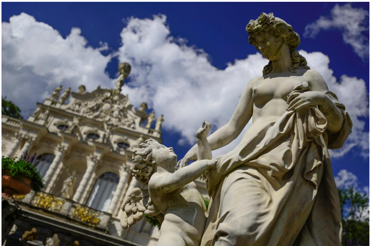
Le château de Linderhof en Bavière

En savoir plus sur la Charte Européenne de Tourisme Durable : http://www.europarc.org/sustainable-tourism/