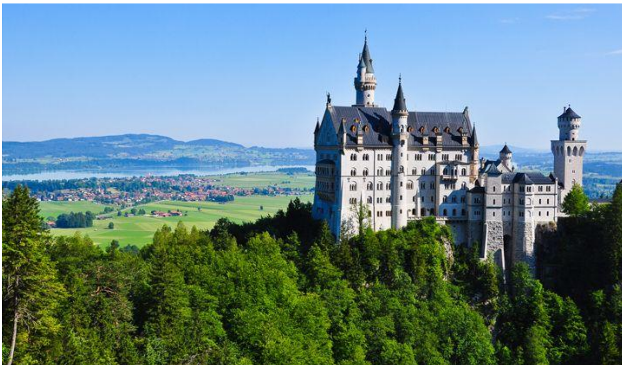
Le château de Neuschwanstein en Bavière

Nous pouvons être amenés à modifier l'itinéraire indiqué : soit au niveau de l'organisation (problème de surcharge des hébergements, dédoublement des groupes, modification de l'état du terrain, éboulements, sentiers dégradés, etc.), soit directement du fait du guide (météo, niveau du groupe, etc.). Ces modifications sont toujours faites dans votre intérêt, pour votre sécurité et pour un meilleur confort !