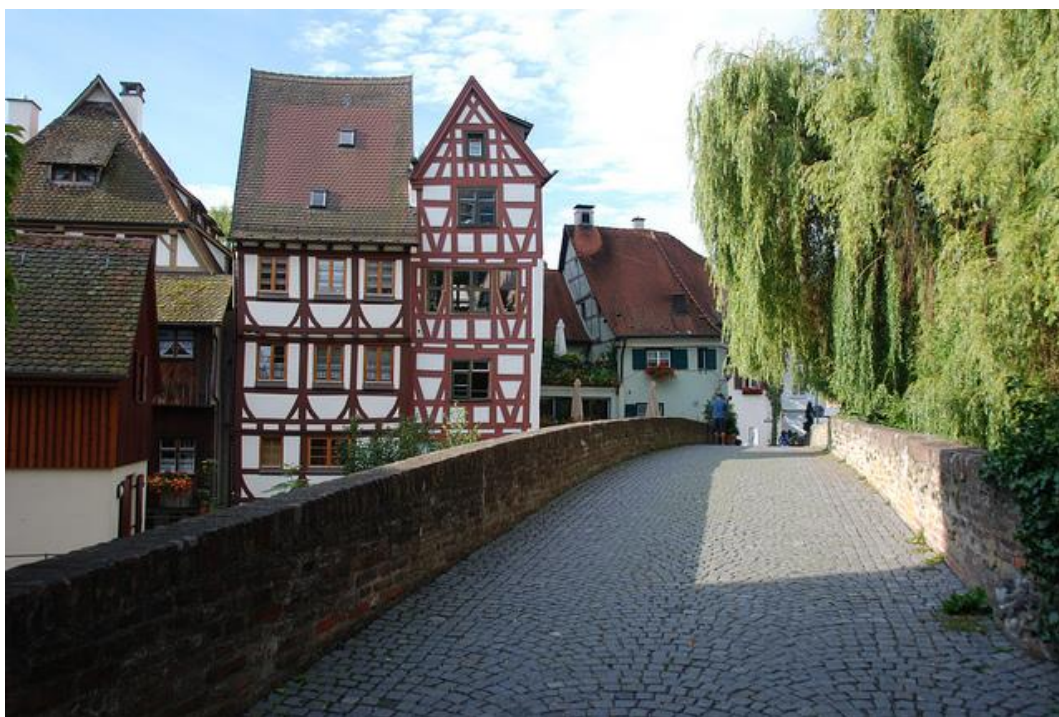
Ulm, le quartier des pêcheurs