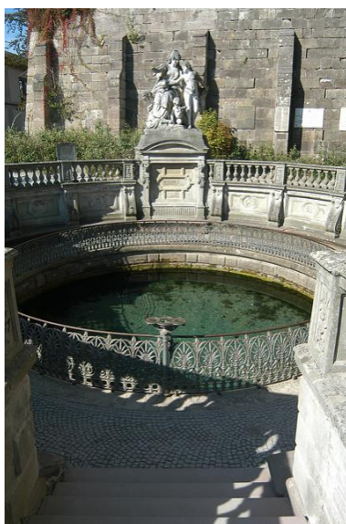
La source du Danube à Donaueschingen