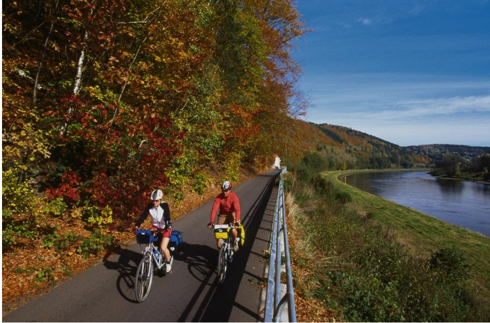
Sur les rives de l'Elbe