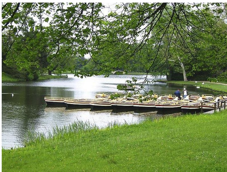
Les jardins de Dessau-Wörlitzer

Fin du séjour après le petit déjeuner. Retour individuel à Dresde ou nuit supplémentaire. Vous avez la possibilité de réserver un transfert retour privé ou en bus (à réserver au moment de l'inscription).