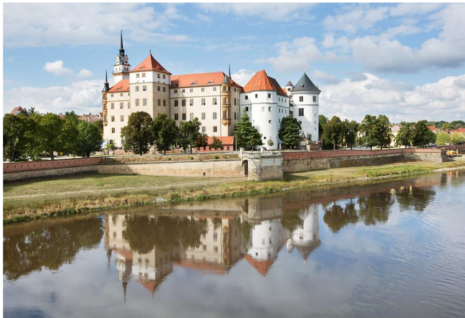
Château Hartenfels à Torgau

* Vous pouvez couper l'étape en 2 et dormir à Pretzsch (soit 33 km le J5 + 35 km le lendemain pour rejoindre Wittenberg)