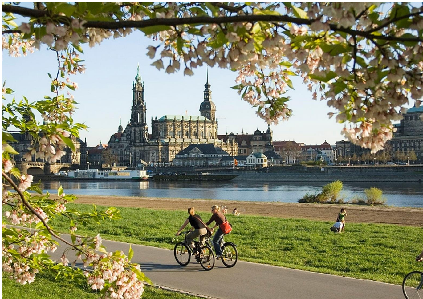
Dresde et l'Elbe

8 jours / 7 nuits • Rien à porter • Niveau : 2/5