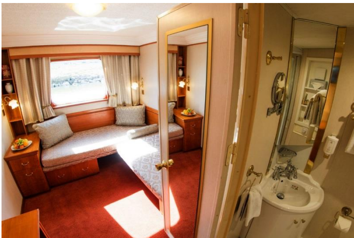
Cabine Pont principal