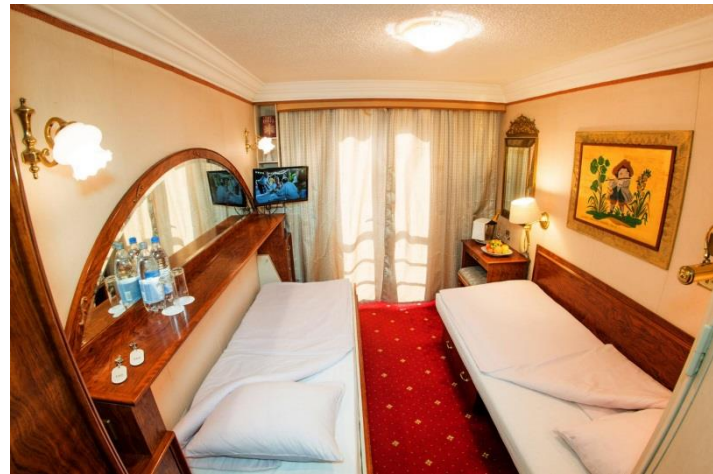
Cabine Pont supérieur