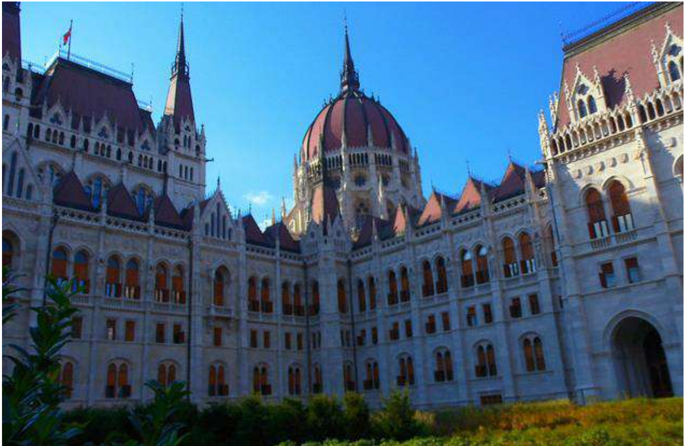
Parlement hongrois, Budapest

8 jours • 7 nuits • Rien à porter • Niveau : 1/5