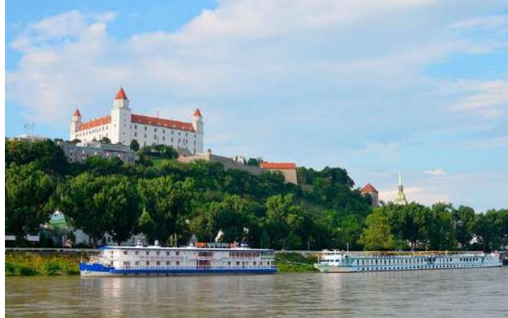
Château de Bratislava au bord du Danube

Navigation de nuit en bateau de Bratislava à Budapest