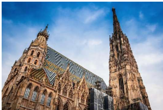
Cathédrale Saint Etienne, Vienne

Navigation de nuit en bateau de Vienne-Nussdorf à Budapest.