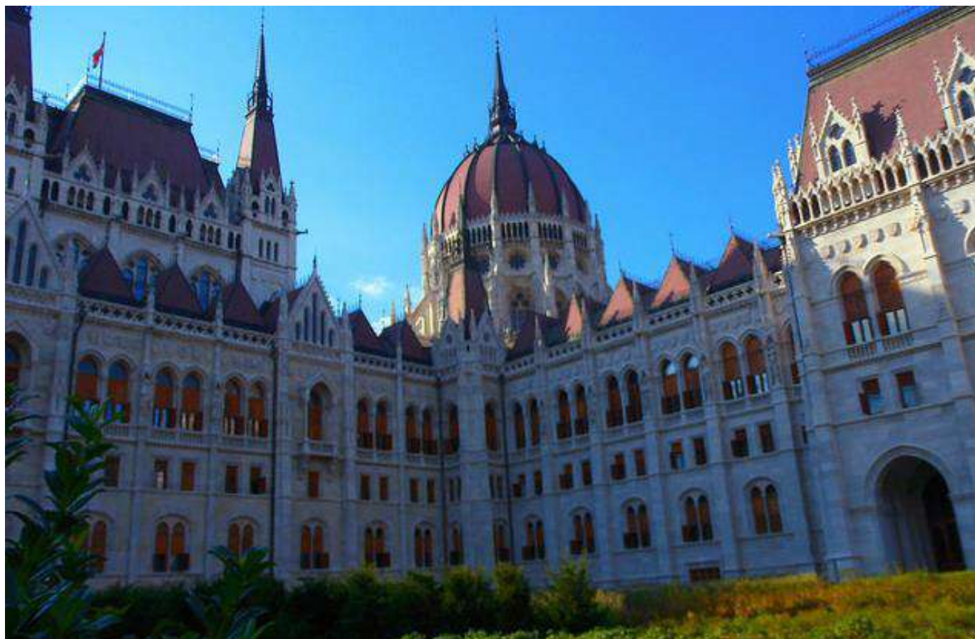
Parlement hongrois, Budapest

8 jours • 7 nuits • Rien à porter • Niveau : 1/5