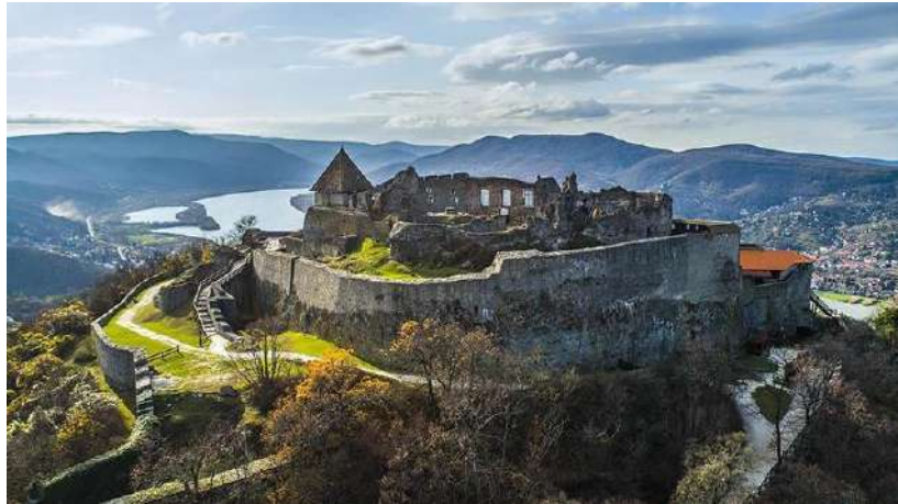
Forteresse de Visegrad

La balade à vélo dans le coude du Danube, appelé la Wachau hongroise, est une excursion dans l'histoire de la Hongrie. L'étape à vélo d'aujourd'hui commence à Visegrad, avec sa célèbre forteresse et les ruines de l'ancien palais. Vous traversez la campagne pittoresque en passant par la péninsule de Szentendre jusqu'au village baroque de Vác, qui a été influencé par les architectes de l'impératrice autrichienne Maria Thérèse. En passant par de petits villages hongrois, vous retournerez à Visegrad. Dans l'après-midi, départ pour Bratislava.