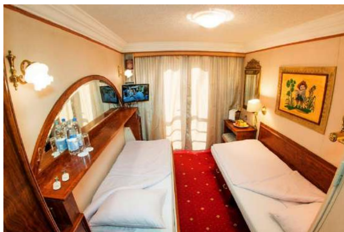
Cabine Pont supérieur