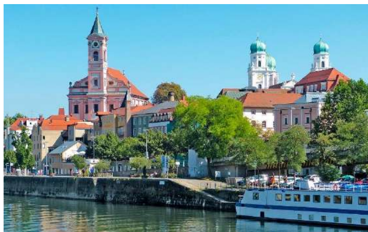
Ville de Passau

Embarquement et accueil à partir de 16h00 et jusqu'à 17h00 ; vers 19h, nous larguons les amarres en direction de Engelhartszell, que nous atteignons vers 22h.