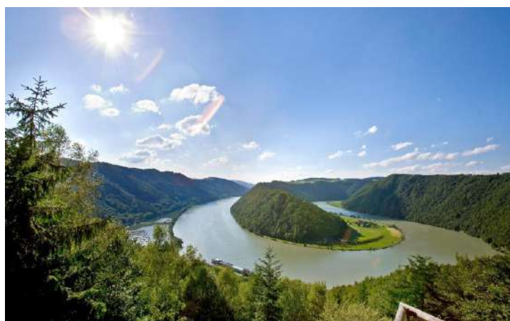
Boucle de Schlogën

Votre balade à vélo commence à Engelhartszell (le seul monastère trappiste en Autriche) et traverse des paysages romantiques, le long des chemins de halage ; vous rejoignez vite la courbe du Danube, superbe méandre où la vallée se resserre. C'est l'un des plus beaux sites naturels du Danube, avec de superbes villages au pied de pentes boisées et verdoyantes. Vous rencontrerez de petits villages et des tavernes accueillantes à ne pas manquer. Vous embarquerez à nouveau à Aschach. Ensuite, vous naviguerez dans la nuit en direction de Vienne-Nussdorf.