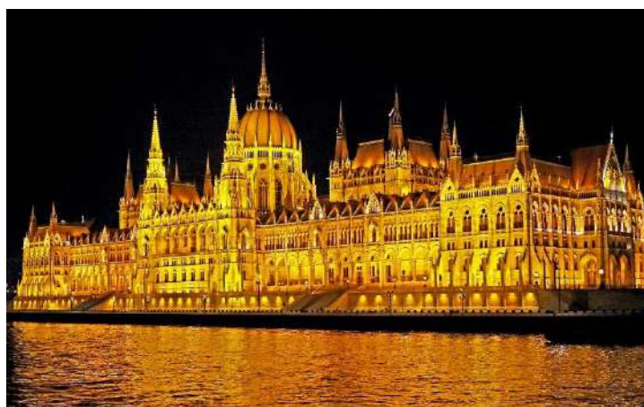
Parlement de Budapest

Vous pouvez choisir de faire une balade à vélo jusqu'à Szentendre, l'île des artistes, qui offre une ravissante vieille ville restaurée, et d'innombrables églises et galeries d'art. Dans la nuit, le bateau repart vers Visegrad.