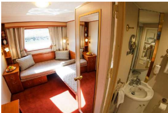
Cabine Pont principal