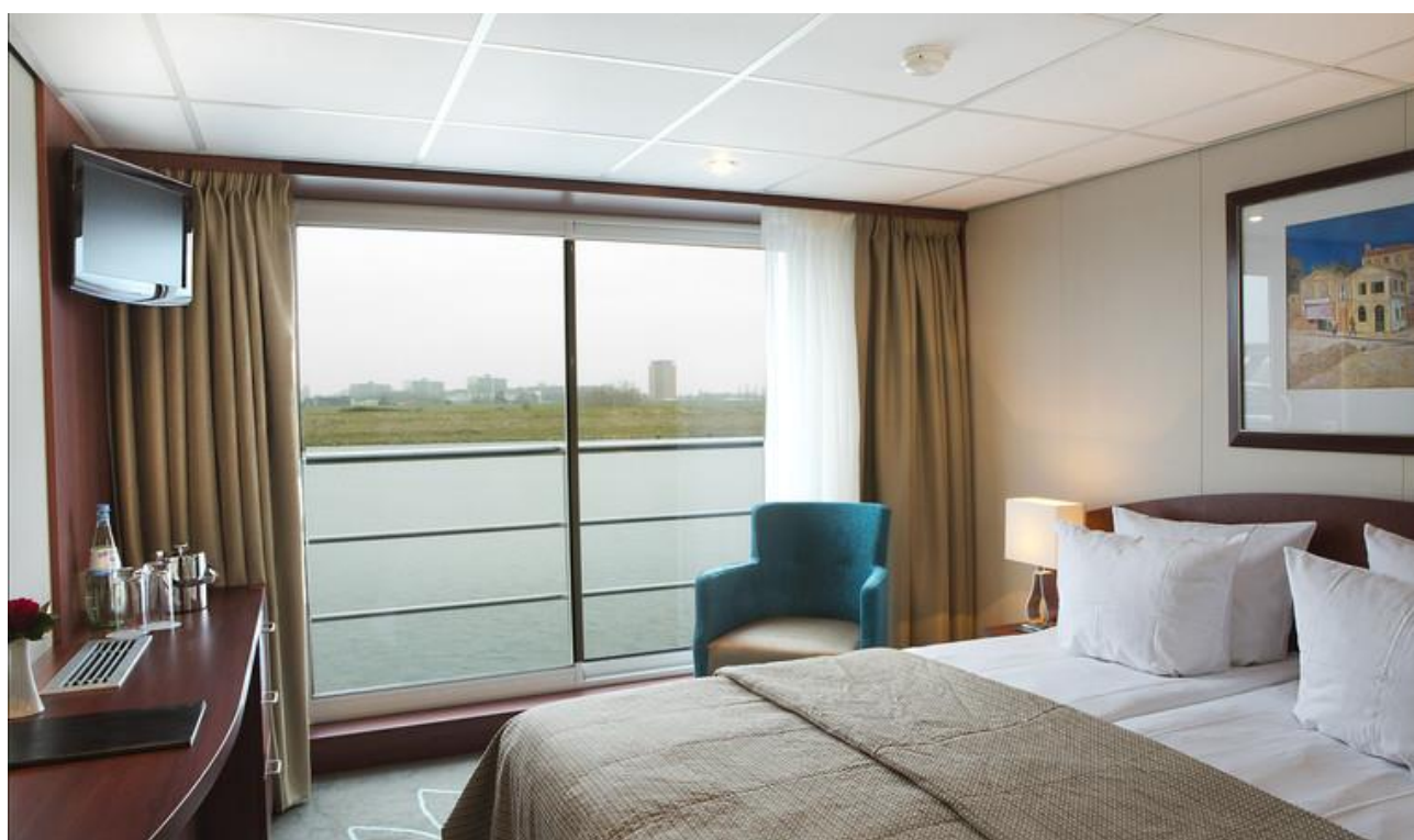
Cabine pont supérieur