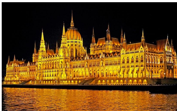
Parlement de Budapest

Vous pouvez choisir de faire une balade à vélo jusqu'à Szentendre, l'île des artistes, qui offre une ravissante vieille ville restaurée, et d'innombrables églises et galeries d'art. Dans la nuit, le bateau repart vers Vác.