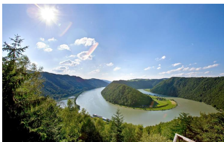
Boucle de Schlogën

Votre balade à vélo commence à l'abbaye baroque rococo d'Engelhartszell, réputée pour ses liqueurs à base de plantes et traverse des paysages romantiques, le long des chemins de halage ; vous rejoignez vite la courbe du Danube, superbe méandre où la vallée se resserre. C'est l'un des plus beaux sites naturels du Danube, avec de superbes villages au pied de pentes boisées et verdoyantes. A Brandstatt, vous regagnez votre bateau, d'où vous pourrez tranquillement découvrir de part et d'autre, sur les rives, des châteaux forts et des monastères.