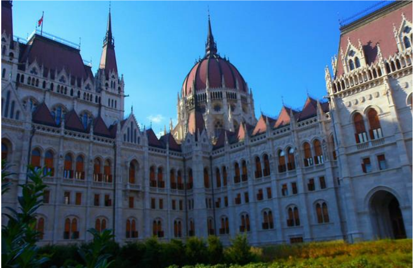
Parlement hongrois, Budapest

8 jours • 7 nuits • Rien à porter • Niveau : 1/5