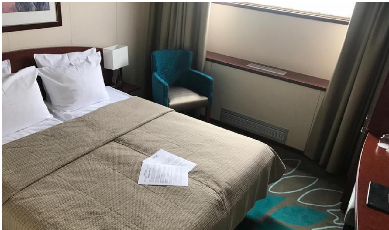
Cabine pont principal

Pont principal : les petites fenêtres (hauteur d'environ 40 cm) ne peuvent pas être ouvertes