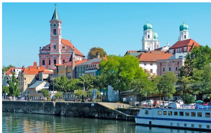
Ville de Passau

Embarquement et accueil de 16h00 à 17h00 ; vers 19h, nous larguons les amarres en direction de Engelhartszell, que nous atteignons vers 21h.