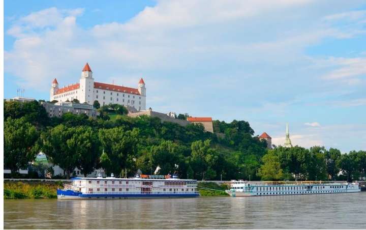
Château de Bratislava au bord du Danube

Arrivée en bateau à Bratislava le matin. Vous commencez votre tour de Bratislava en passant par Hainburg pour aller vers l'imposant château Schloss Hof, ancienne résidence impériale et chef d'œuvre de l'art baroque, avec tout particulièrement un jardin qui s'étend sur sept terrasses descendant vers la Morava pour arriver à Devin. Vous retournez vers Bratislava. Notre conseil : partez à la découverte de la ville merveilleuse à bord du petit train « Oldtimer » (non comprise, à payer sur place). Dans la nuit, navigation vers Budapest.