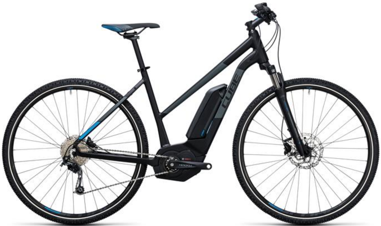
Cube Cross Hybrid Pro Allroad 500

Ce vélo se caractérise par son poids léger (20kg sans batterie) et adapté au tout terrain. Il est équipé d'un moteur très performant. La durée de la batterie est de 500 Wh. Il possède 9 vitesses. Jusqu'à 1m79 nous proposons un vélo modèle femme, au-delà d'1m80 nous fournissons un vélo modèle homme.