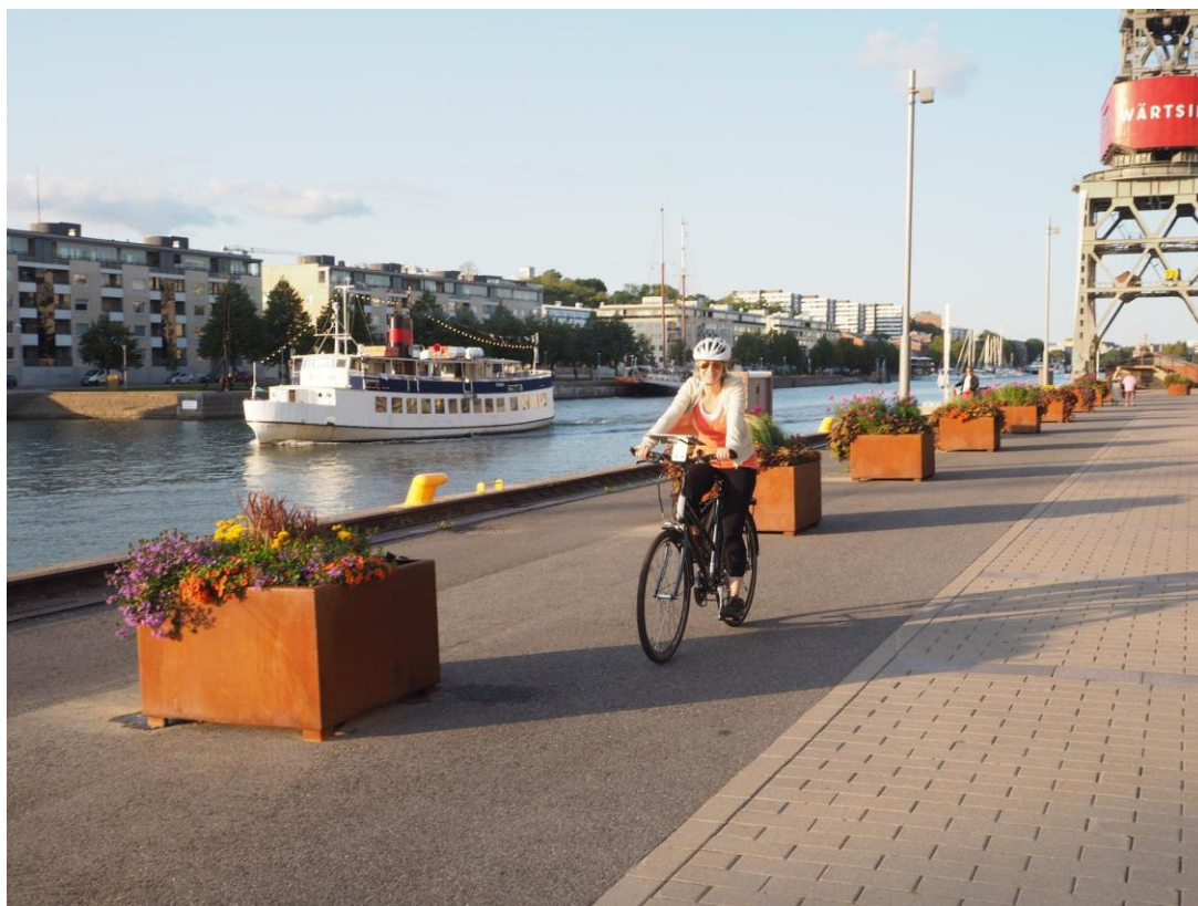
Description de la photo © Copyright

8 jours • 7 nuits • Rien à porter • Niveau : 3 / 5