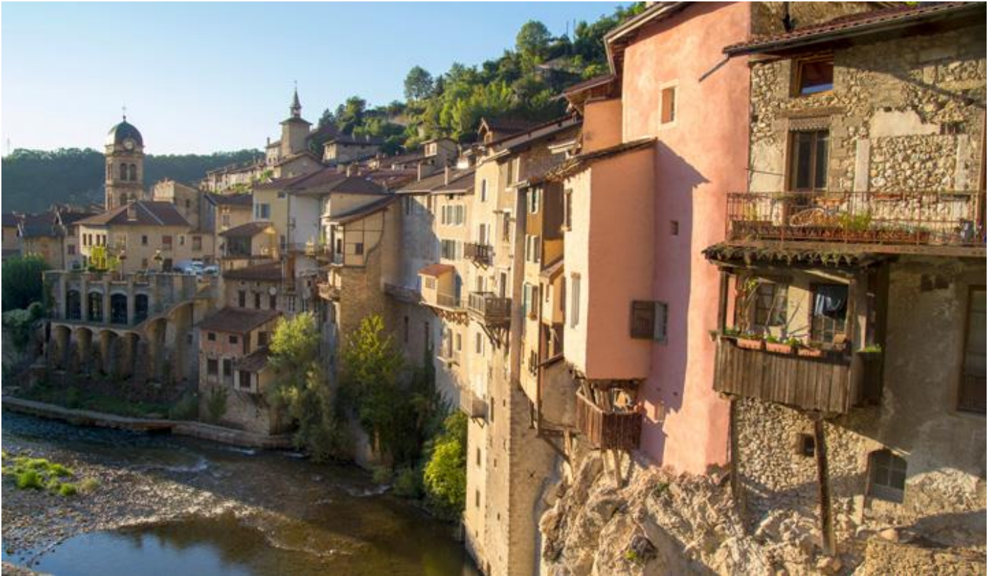
Village de Pont-en-Royans

7 jours • 6 nuits • Rien à porter • Niveau : 3 / 5