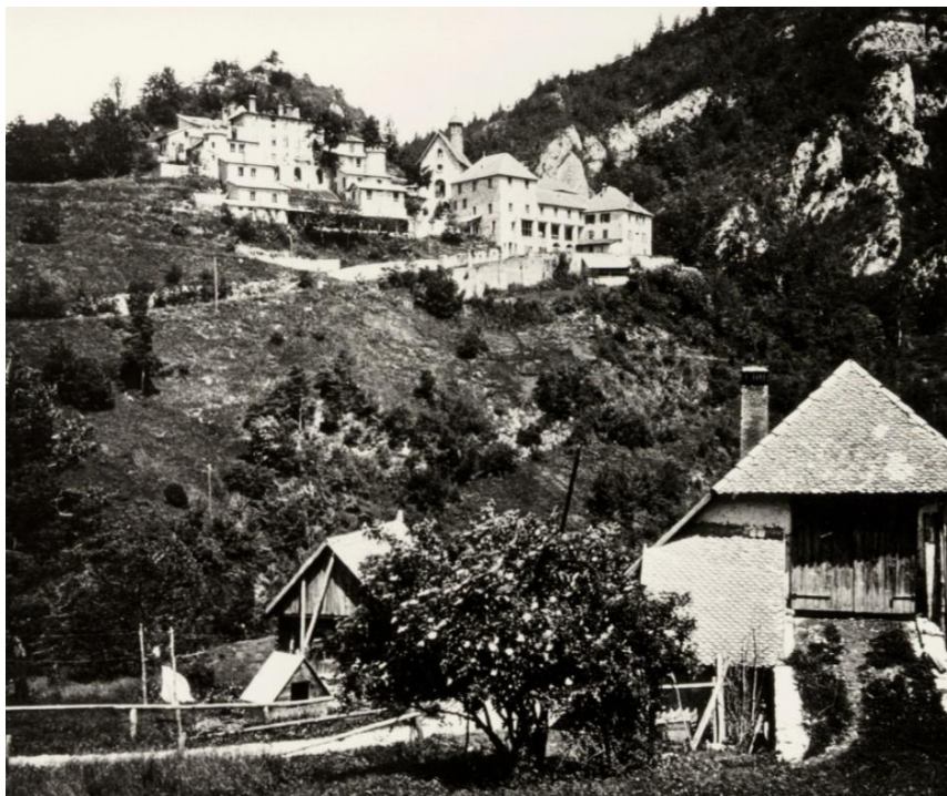
La ferme d'Esparron et l'ermitage d'Esparron en arrière-plan (avant 1940)

En savoir plus sur la Charte Européenne de Tourisme Durable .