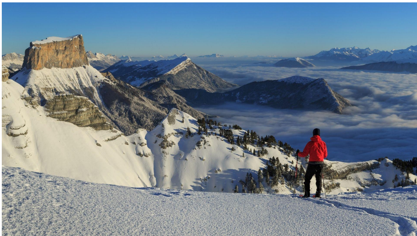
Vercors, Trièves et Mont Aiguille depuis la réserve des Hauts Plateaux du Vercors

4 jours • 3 nuits • Portage allégé • Niveau : 2/5