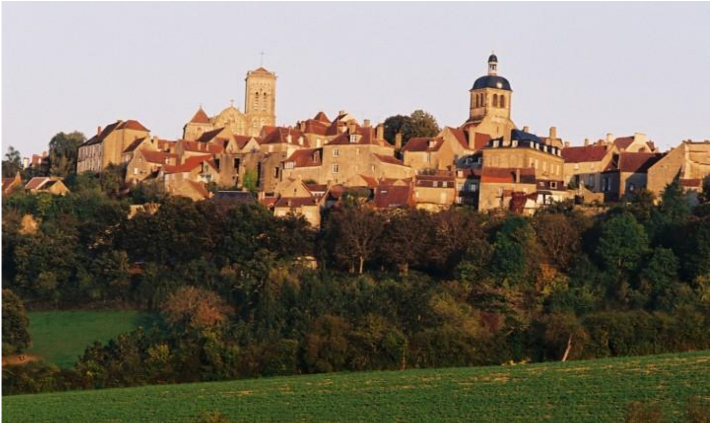
Coline de Vezelay

11 jours • 10 nuits • Rien à porter • Niveau : 3 / 5