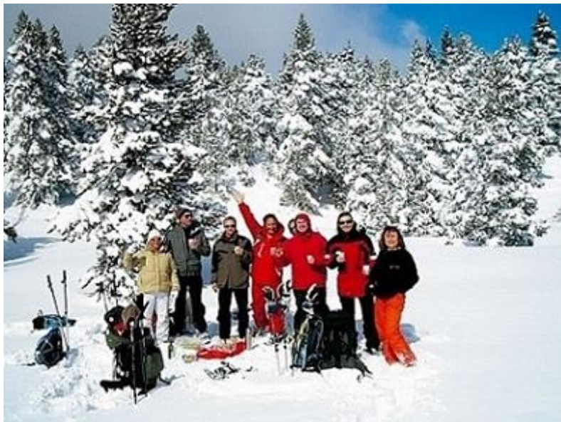
Sur le chemin de la Molière

Nous faisons étape au Col de la Croix Perrin, où nous apprécierons le confort chaleureux de l'Auberge de la Croix Perrin, (2 étoiles). +200 à +450 m, -400 m, 4 à 6h de marche.