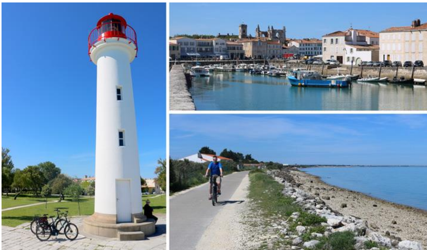
Paysages de l'île de Ré

7 jours • 6 nuits • Rien à porter • Niveau : 2 / 5