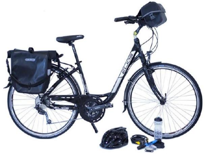
VTC "Rando": Elios Touring