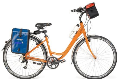
- de pneus anti-crevaison VTC modèle homme