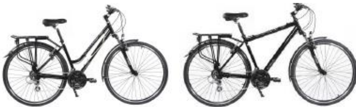
Gamme supérieur : Arcade Escape