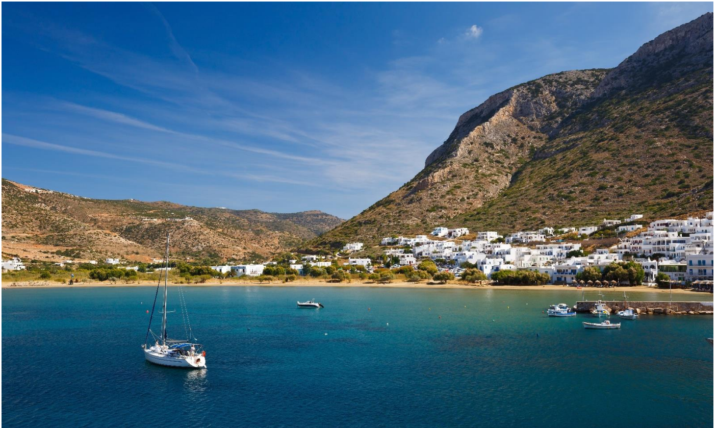
La baie de Kamares, Sifnos

10 jours • 9 nuits • Rien à porter • Niveau : 2/5