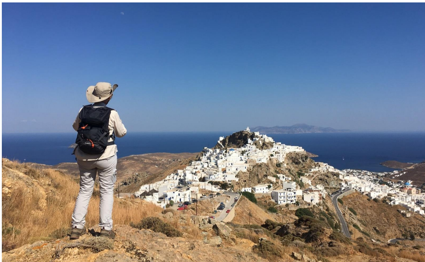
Randonnée au-dessus de Chora, Serifos

8 jours • 7 nuits • Rien à porter • Niveau : 2/5