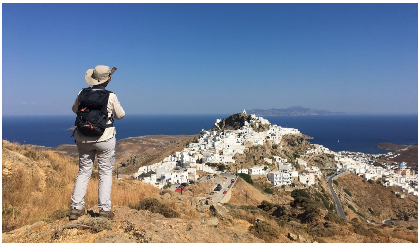
Randonnée au-dessus de Chora, Serifos

10 jours • 9 nuits • Rien à porter • Niveau : 2 / 5