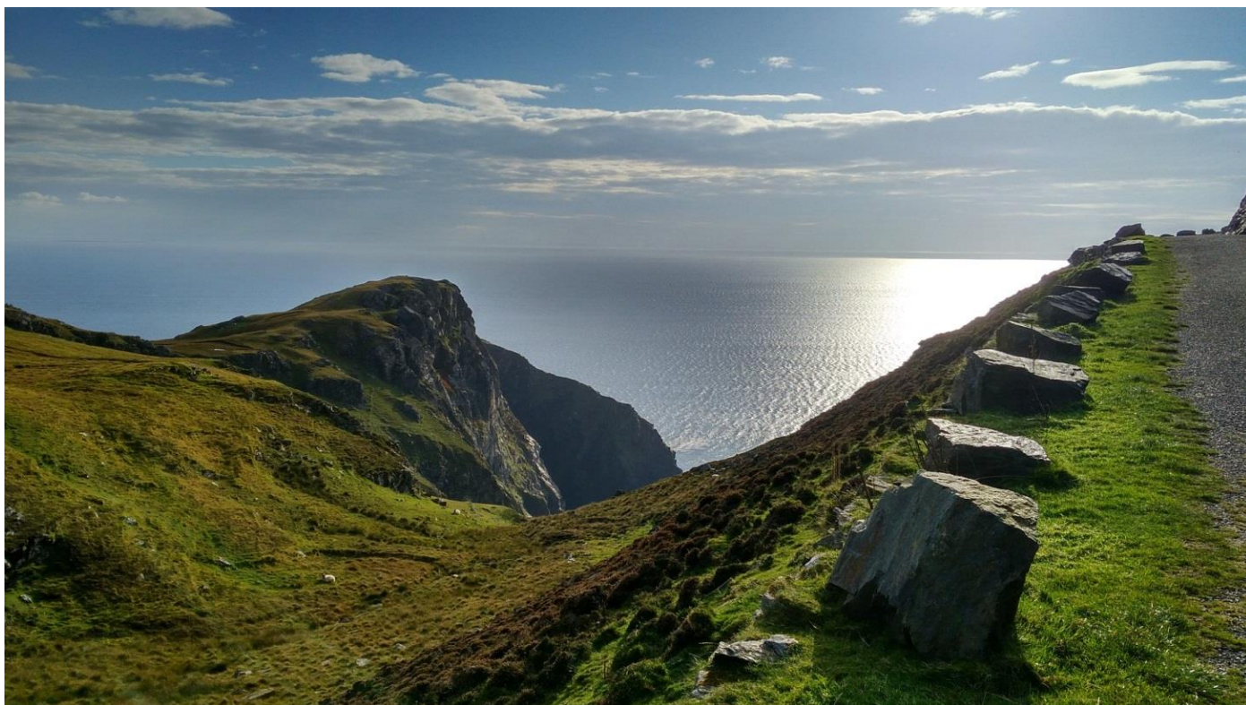
Côte Atlantique Irlande

8 jours • 7 nuits • Rien à porter • Niveau : 2 / 5