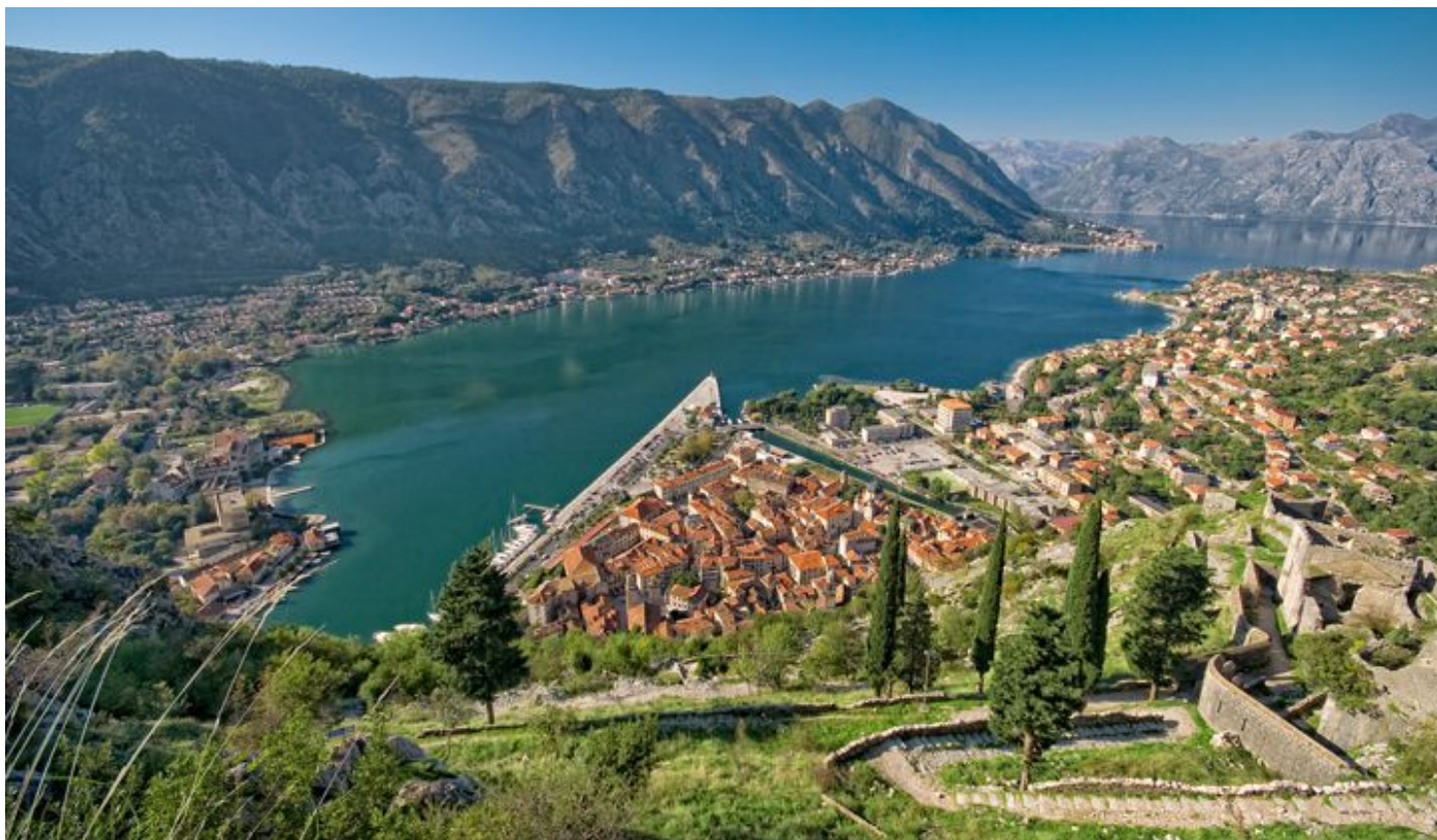
Kotor et les bouches de Kotor - Monténégro

8 jours • 7 nuits • Rien à porter • Niveau : 4 / 5