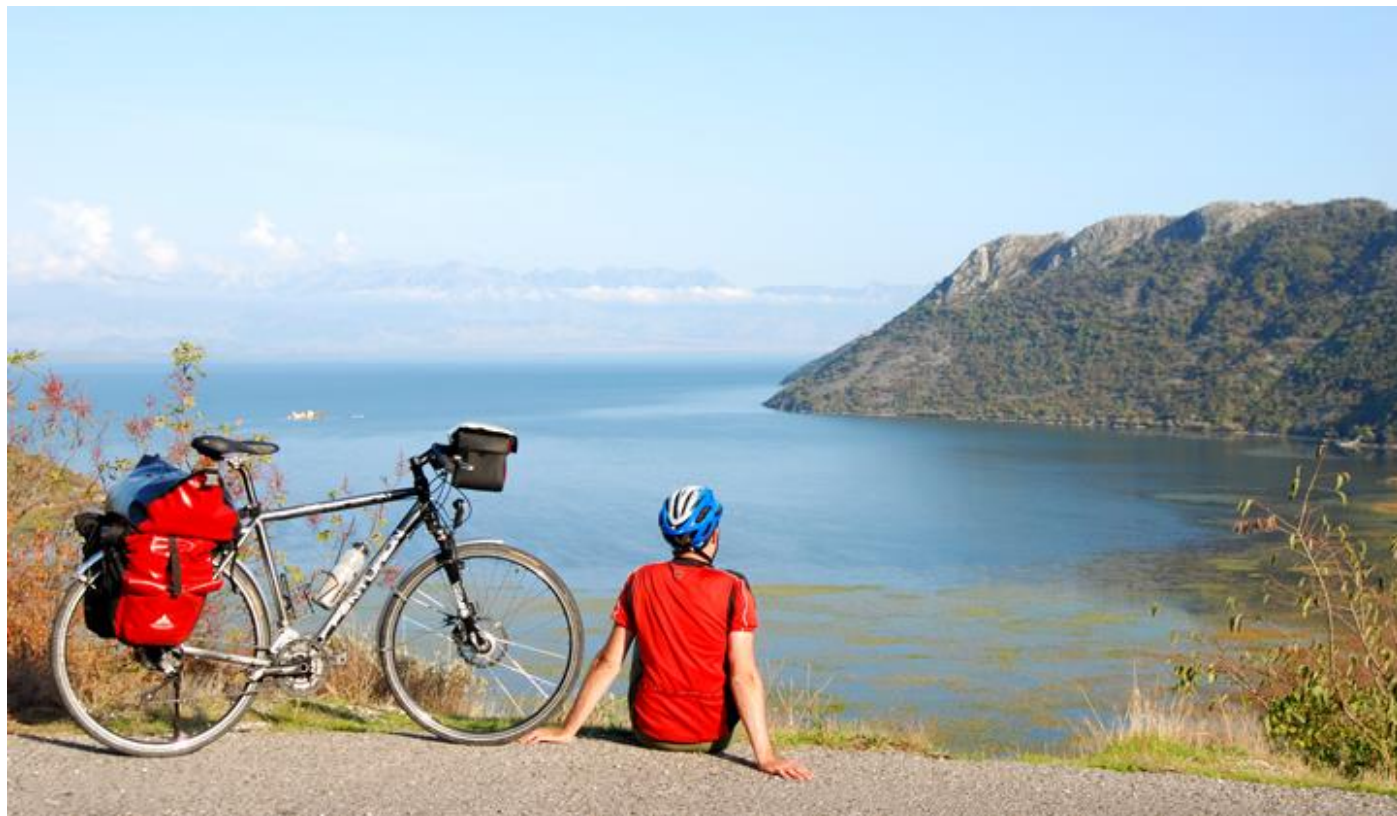
Point de vue sur le lac de Skadar peu après Virpazar - Monténégro

8 jours • 7 nuits • Rien à porter • Niveau : 3 / 5