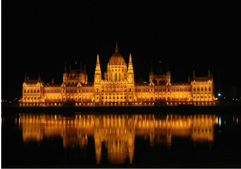
Parlement hongrois à Budapest