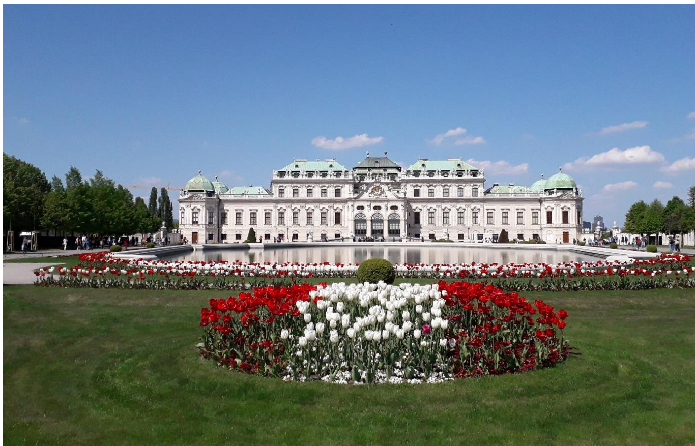
Palais du Belvédère à Vienne

8 jours • 7 nuits • Rien à porter • Niveau : 2 / 5