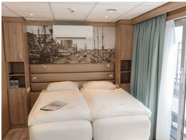
Cabine double pont supérieur