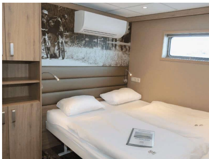
Cabine twin pont inférieur

Le pont inférieur dispose de 21 cabines twin et de 3 triples. Les cabines ont une grande fenêtre mais elle ne peut pas être ouverte pour des raisons de sécurité.