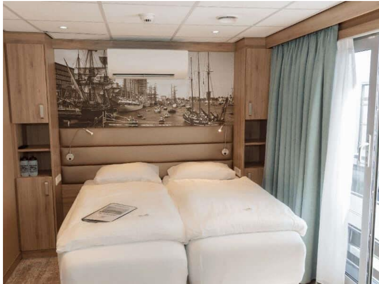
Cabine double pont supérieur