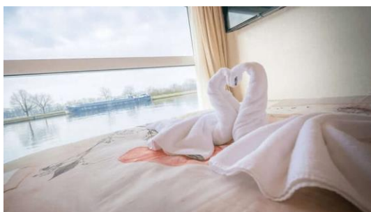
Cabine double pont supérieur