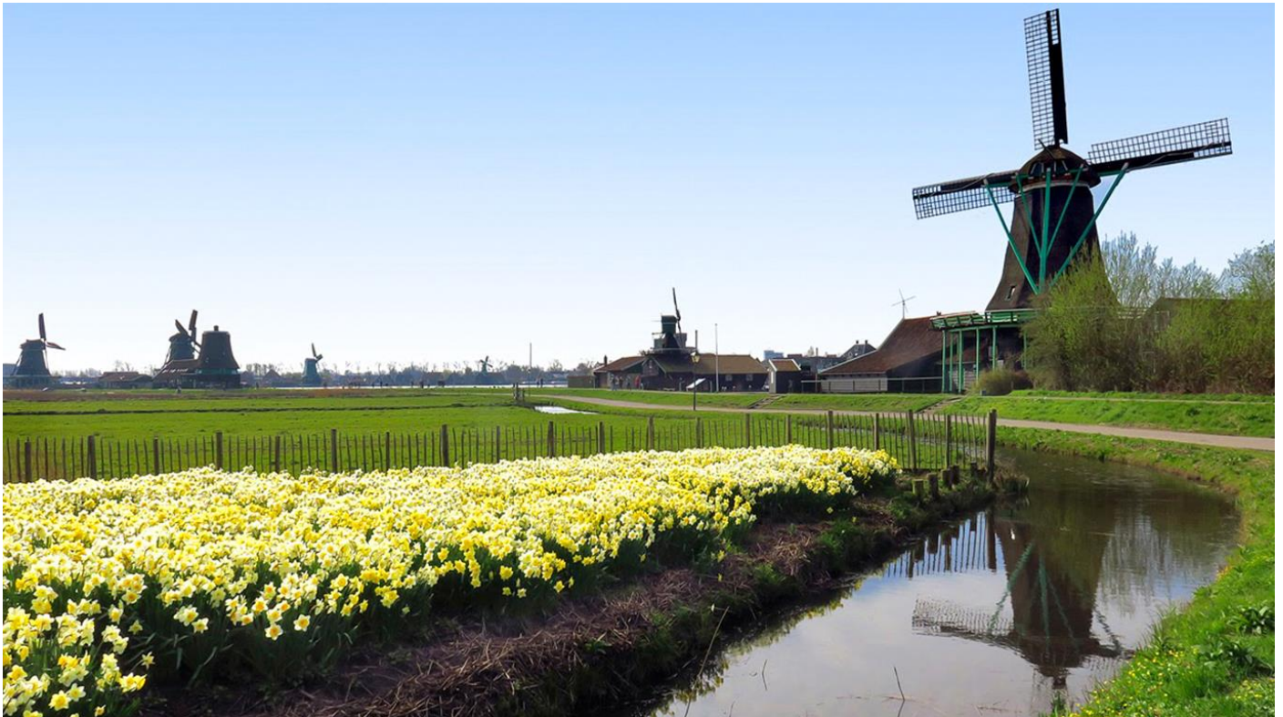
Moulin hollandais

5 jours • 4 nuits • Rien à porter • Niveau : 1 / 5