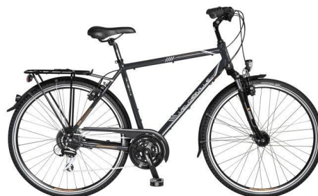
VTC vélo homme