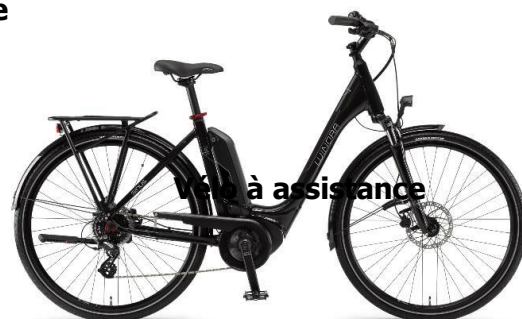
Vélo à assistance

Matériel fourni : sacoche au guidon, porte-bagage, gourde, kit de réparation, siège confortable cadenas et un compteur kilométrique.