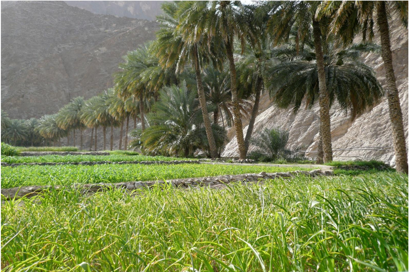
Palmeraie de Wadi Bani Awf

14 jours • 13 nuits • Rien à porter • Niveau : 4 / 5