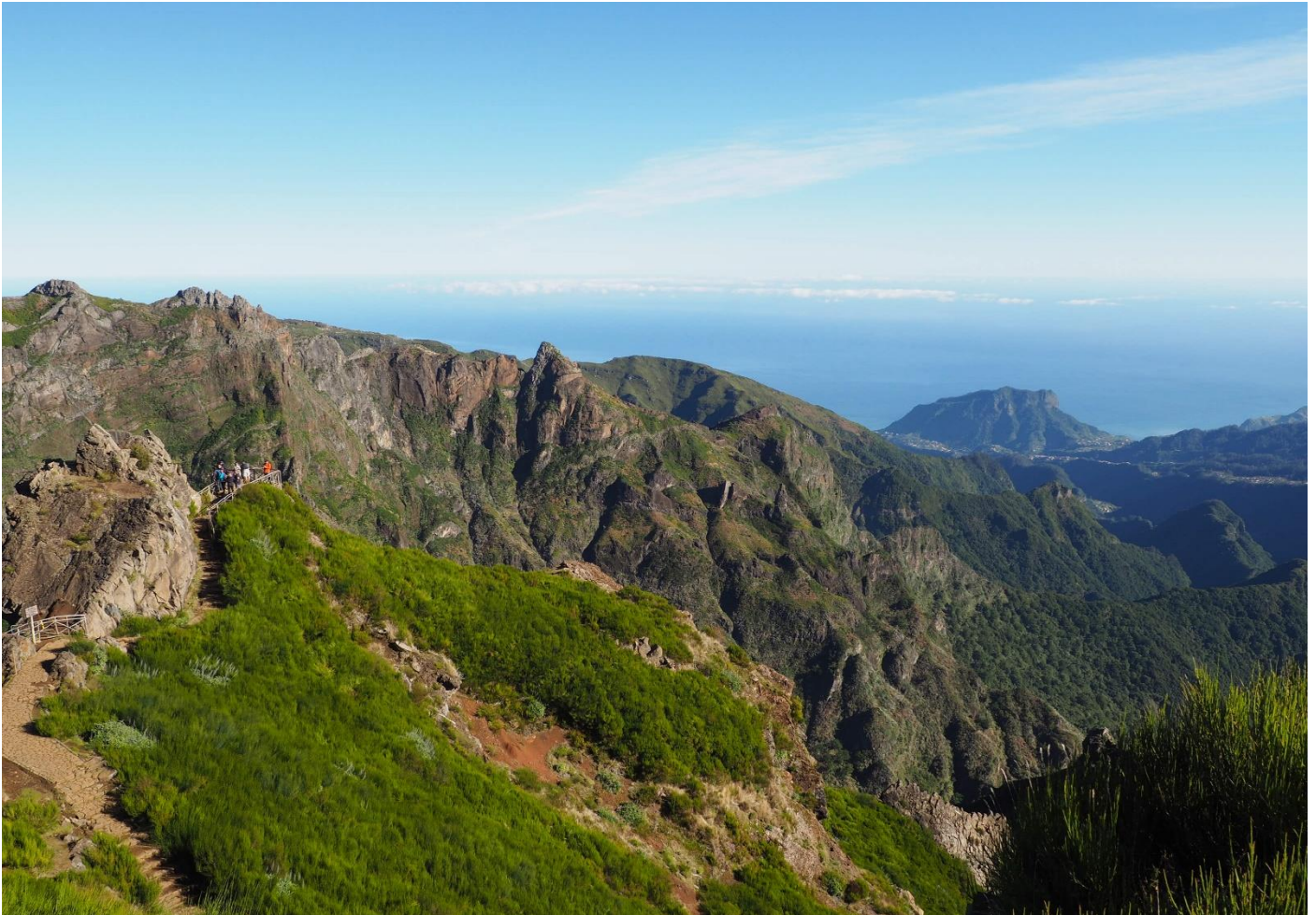
Pico do Areeiro

14 jours • 13 nuits • Rien à porter • Niveau : 3 / 5