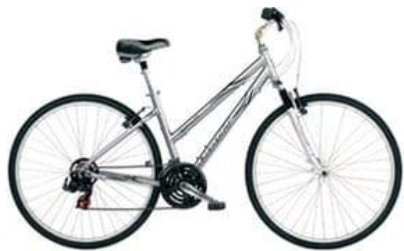
Femme Taille : XS, S et L