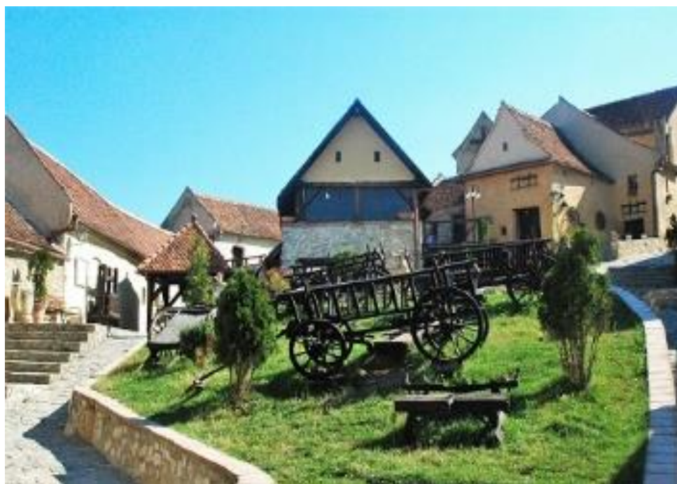
Village préservé de Rasnov

En savoir plus sur la Charte Européenne de Tourisme Durable : http://www.europarc.org/sustainable-tourism/