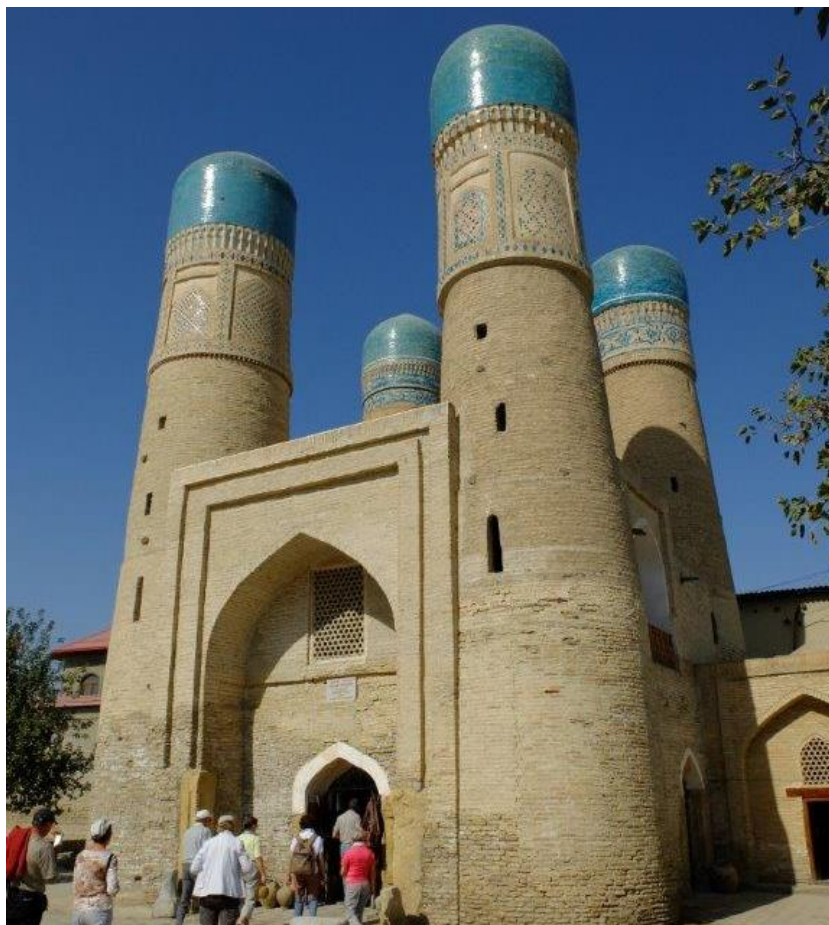
Tchor Minor (« quatre minarets »)