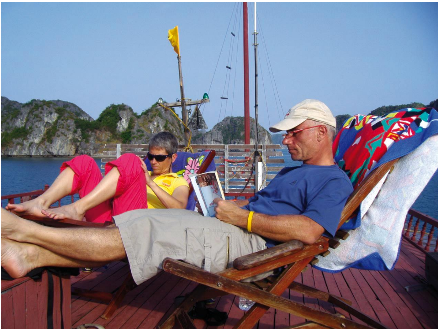
Le Funan Cruise (Delta du Mékong)